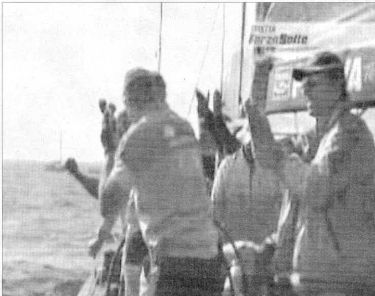
Imagen captada de la televisión en la que se ve al tático del Desafío John Cutler (dcha.) haciendo un corte de mangas.

Pese a todo, Cutler intentó disculparse el sábado personalmente con Vasco Vascotto, patrón del Mascalzone, y se ha justificado diciendo